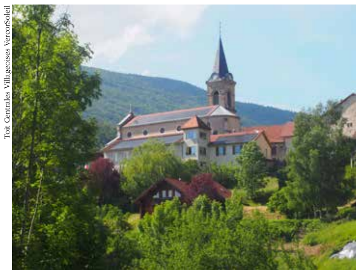
Toit Centrales Villageoises VercorsSoleil

Une production de 900 000 kWh par an (soit la consommation d'électricité d'environ 900 personnes)