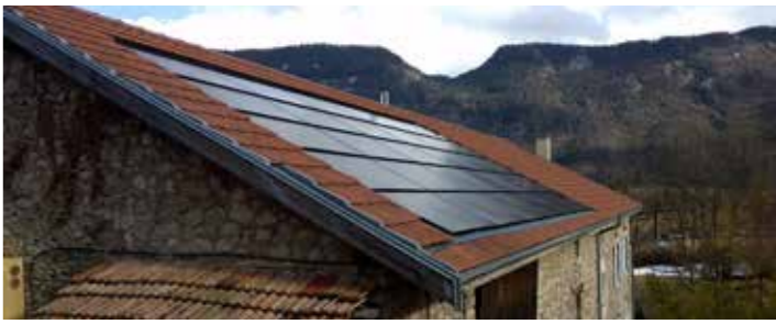
Toit Centrales villageoises de VercorSoleil