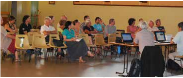
Temps de concertation entre les actionnaires Centrales villageoises Portes du Vercors

☀ plus d'infos : L'association nationale des Centrales Villageoises a été créée en 2018 - www.centralesvillageoises.fr