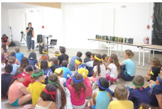
Journée de restitution à Autrans avec près de 200 élèves

Une restitution des travaux des élèves en présence de toutes les classes, enseignants et intervenants a été organisée le 5 juillet au Centre le Vertaco à Autrans (Ligue de l'enseignement), permettant à tous de prendre la mesure du travail de chaque classe. Que ce soient sous la forme de films, de performance, de scénettes de théâtre d'ombre, de théâtre, de planches de BD, de fresque ou de maquette, les élèves ont pu partager leur souhaits pour le territoire de demain. Protéger la forêt, maintenir un équilibre entre biodiversité et activités agricoles mais aussi entre biodiversité et pratiques touristiques, travailler sur des modes de déplacements non polluants et innovants ressortent de leurs réflexions et viennent abonder la participation des élus, socio-professionnels et habitants du territoire.