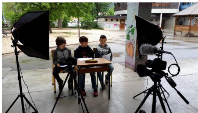
Interview des élèves de Die : quelle mobilité pour demain ?