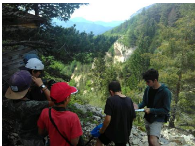
Les élèves de Menglon en surveillance des gypaètes barbus

9 classes du périmètre du Parc ont répondu à l'appel à projet lancé au printemps 2019 et ont été accompagnées tout au long de l'année 2019-2020. Ce projet pédagogique, co-construit avec nos partenaires de l'Education Nationale et en lien étroit avec les enseignants s'est articulé autour de trois axes : Éducation à l'Environnement et au Développement Durable ; Éducation à la citoyenneté ; Éducation Artistique et Culturelle . Ces trois clés d'entrées répondent aux programmes scolaires et aux compétences travaillées à l'école. Une forte implication des équipes enseignantes a été nécessaire pour mener à bien les nombreuses interventions (avec des intervenants extérieurs ou menées en autonomie) proposées dans chaque classe.