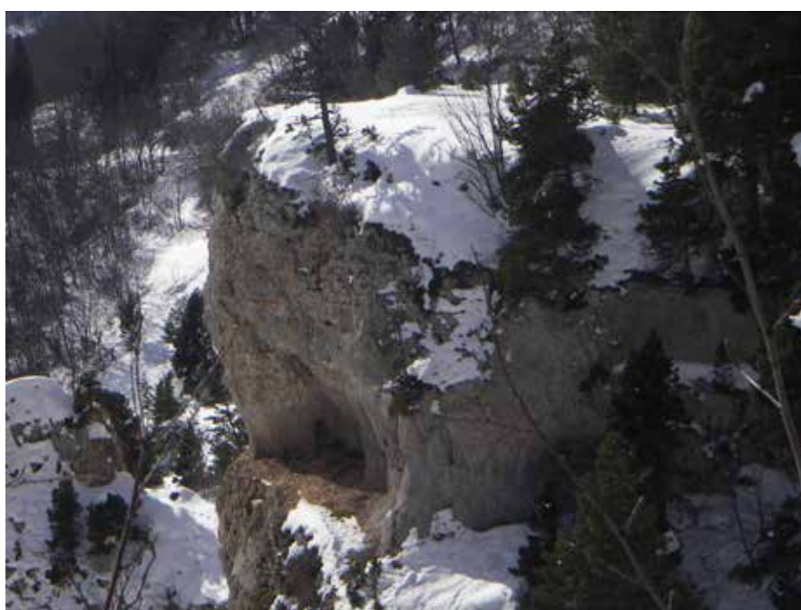
zoom sur la cavité, à partir du point d'observation