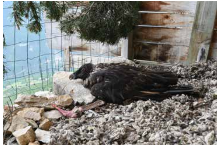
Ci-dessus, l'oiseau dans la cavité qui l'accueille jusqu'à son envol (2020)