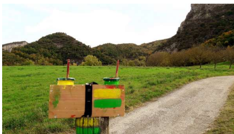
Marques de balisage jaune-vert (sentiers du PNRVercors)