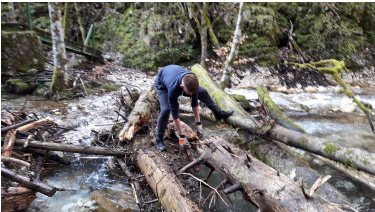
Nettoyage du site du Furon avec des arbres obstruants l'activité canyoning