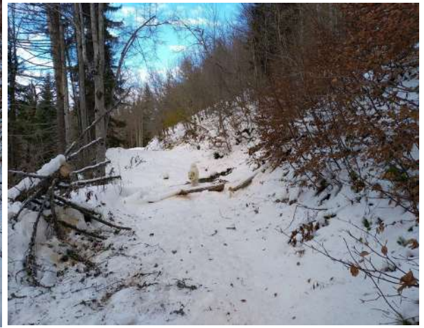
Ouverture du sentier par le tronçonnage d'un gros arbre