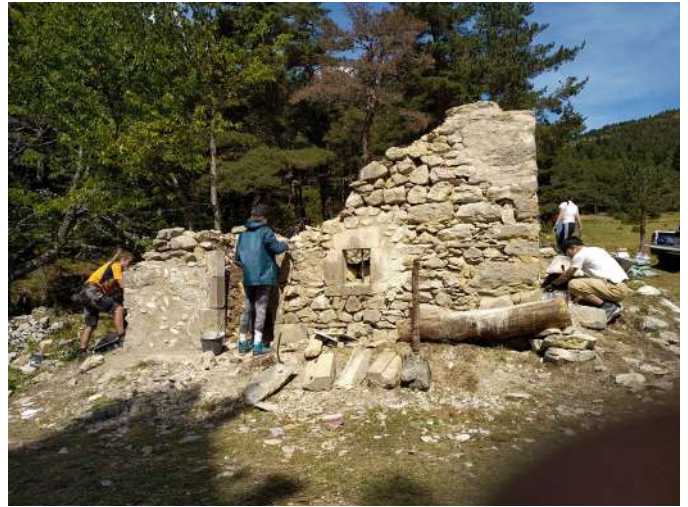
Photos du chantier Concordia autour de la ruine de Côte Chèvre