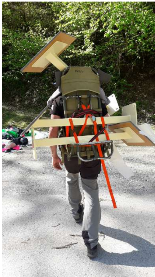
Portage et installation d'un panneau sur le site de Bournillon pour la mise en valeur dont son patrimoine spéléologique