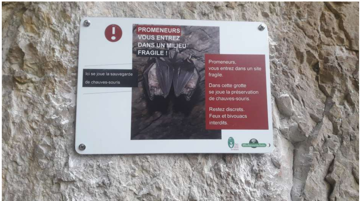
Panneau d'information de zone sensible par la présence de chauves souris sur un site d'escalade