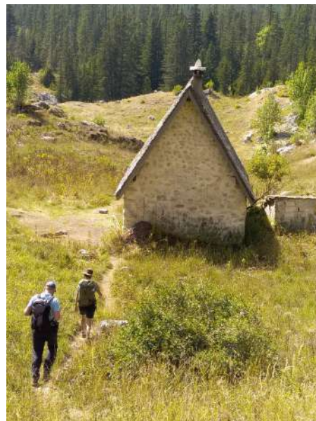
Tournée de surveillance sur la Réserve des Hauts Plateaux

Ces tournées se déroulent en binôme avec les gardes assermentés de la Réserve afin de partager différentes expériences, de pouvoir constater d'éventuelles infractions et si besoin de verbaliser. La gendarmerie de Villard-de-Lans nous fournit un soutien logistique et humain pour pouvoir optimiser au maximum ce type de tournée de surveillance.