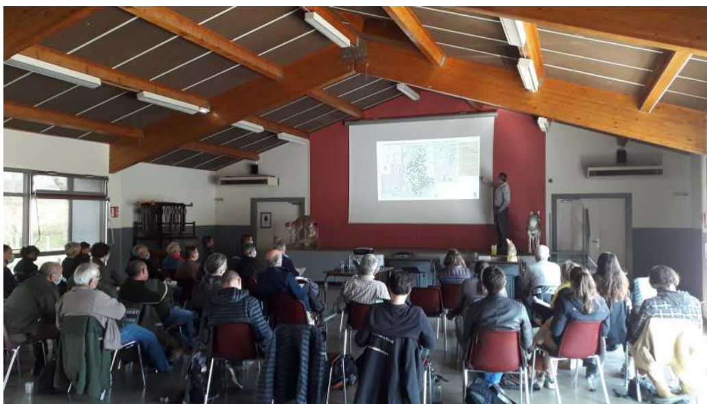
Formation grands prédateurs

- une formation de deux jours « Correspondant Grands prédateurs: Loup et Lynx » organisée par l'OFB sur tout le territoire français a été mise en place en mars sur la commune de Crest. L'objectif était d'acquérir plus de connaissance sur ces deux espèces. Cela me permet dorénavant de pouvoir collecter des excréments ou des poils laissés par les Loups.