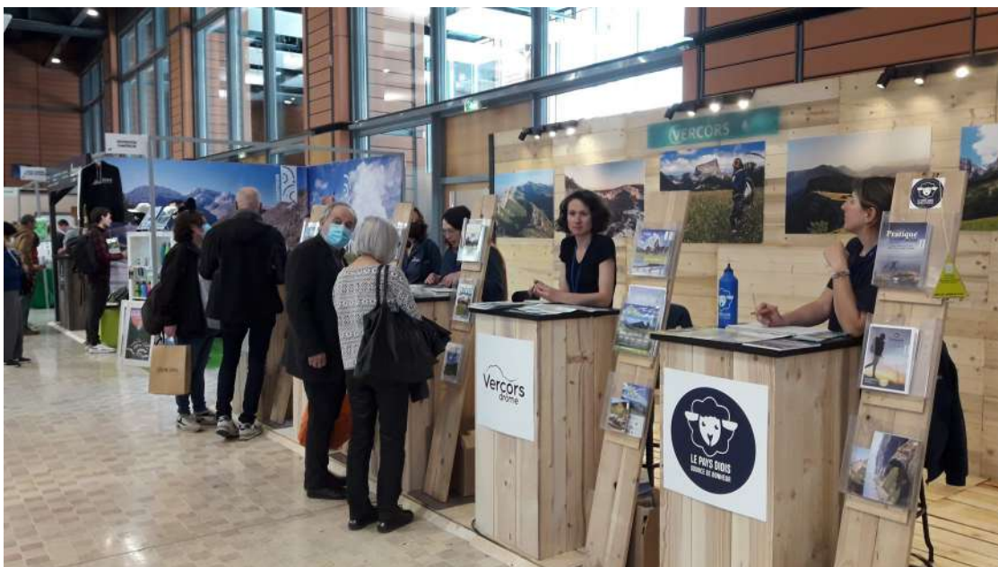
Salon du randonneur à Lyon : accueil et information Vercors avec les offices de tourisme

Bilan : beaucoup de personnes contactées et un grand nombre d'informations passées aux visiteurs.