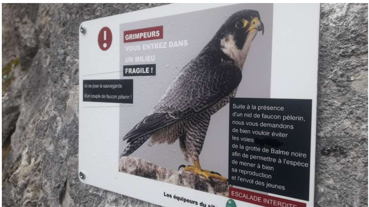
Panneau d'information de zone sensible par la présence d'un couple de faucon pèlerin sur un site d'escalade