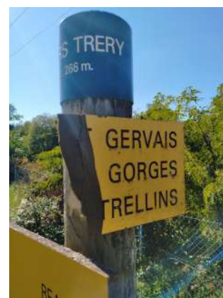
Lame de signalétique cassée