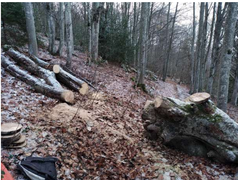
Nettoyage de sentier avec le tronçonnage d'un gros arbre sur un itinéraire de randonnée