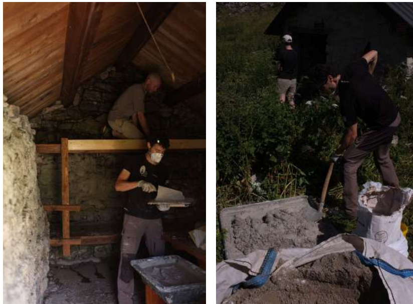
Chantier de rénovation de l'abri de Tiolache

Dans un souci de réduire au maximum les nuisances et impacts sur la Réserve naturelle, les matériaux (les quatre cent kg de sable pour la chaux, les outils, l'eau et tout le petit matériel) ainsi que le nouveau poêle ont été acheminé à dos d'homme et avec deux ânes loués. Ce chantier de qualité a ainsi redonné une seconde vie à cet abri relativement fréquenté par les randonneurs tout au long de l'année.