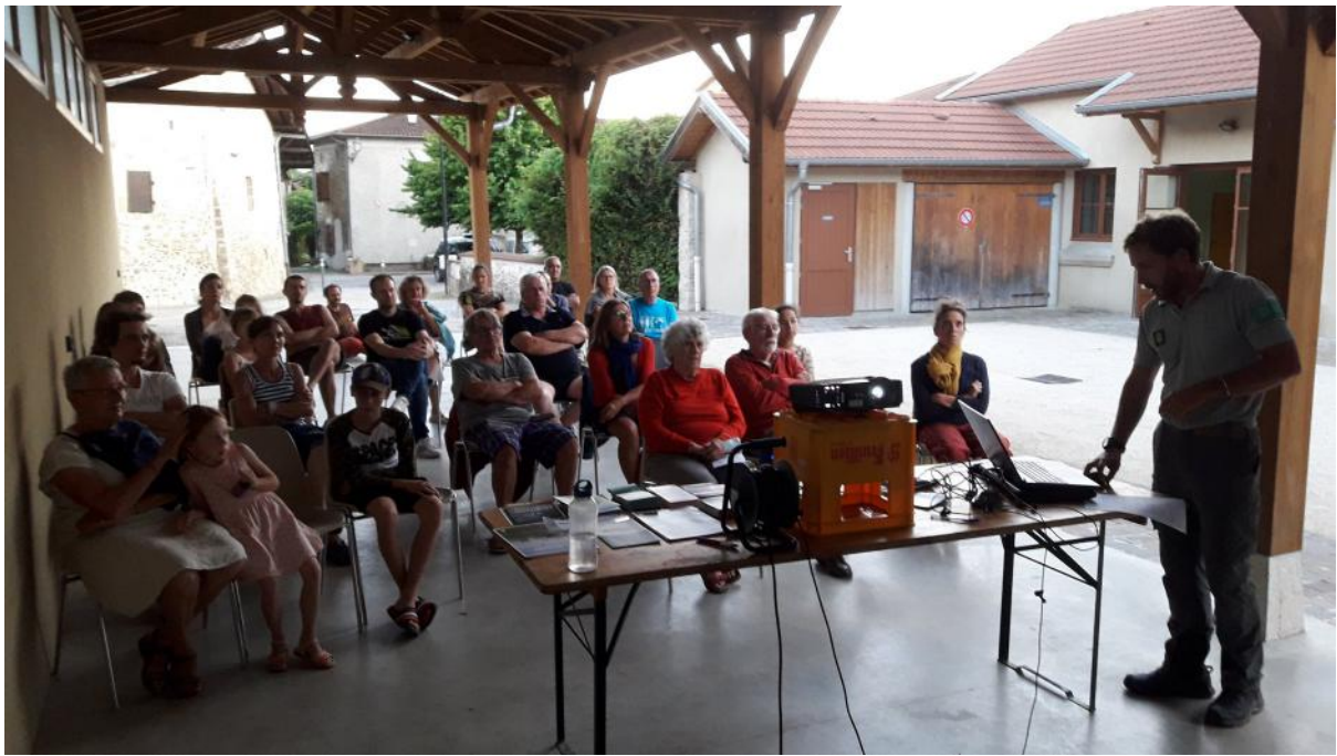
Soirée projection à Beauvoir-en-Royans