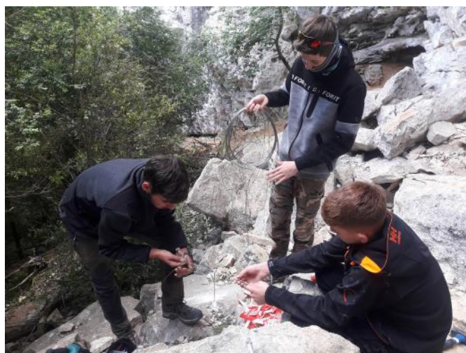
Mise en défend de pieds de Myosotis avec des stagiaires.