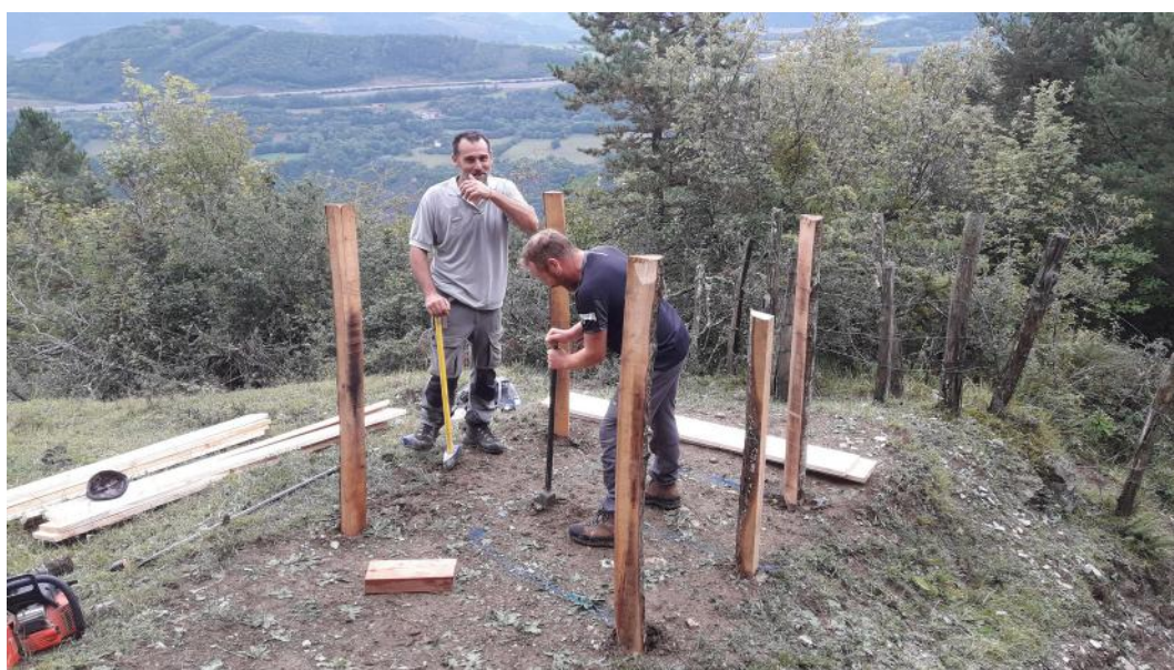
Construction d'une chicane