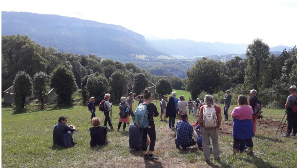
Journée du patrimoine à la Goulandière

Une soixantaine de personnes ont participé à cette journée ce qui a permis de sensibiliser des « locaux » mais aussi des visiteurs venus de l'extérieur.