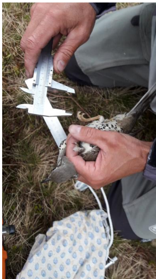
Comptage STOC sur le site de la Molière.

Fin août s'est déroulé le protocole « hurlements provoqués Loup » organisé par l'Office Français pour la Biodiversité sur le secteur sud Vercors (Col de la Bataille-Léoncel). Des équipes de deux ou trois personnes ont été réparties sur une vaste zone afin de réaliser le protocole et de noter, le cas échéant, les réponses de jeunes louveteaux enregistrés.