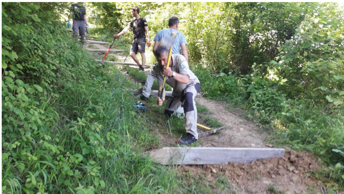
Pose de marches