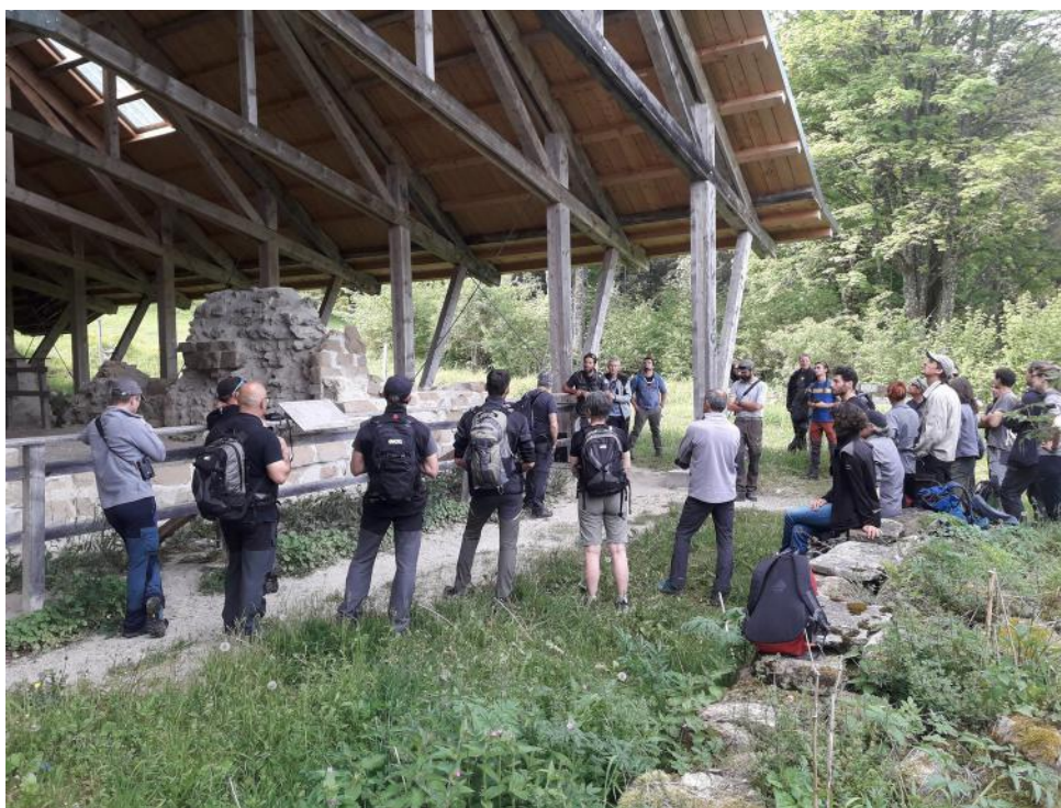
Rencontre avec les gardes et écocardes des départements et du Parc