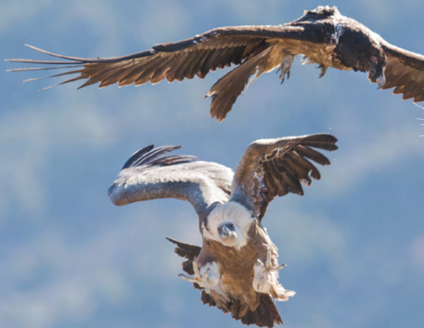
GYPAÈTE BARBU ET VAUTOUR FAUVE